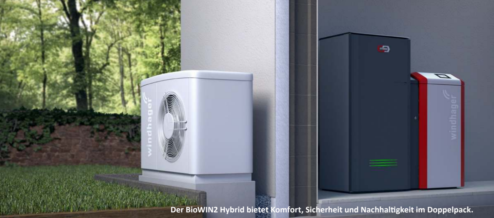
Der BioWIN2 Hybrid bietet Komfort, Sicherheit und Nachhaltigkeit im Doppelpack.