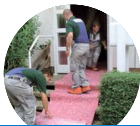
Vliestoppich wird ausgelegt