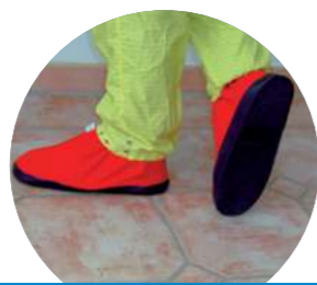
Schutzschuhe werden übergezogen