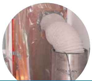
Absaug-System mit Staubschutzwand im Einsatz